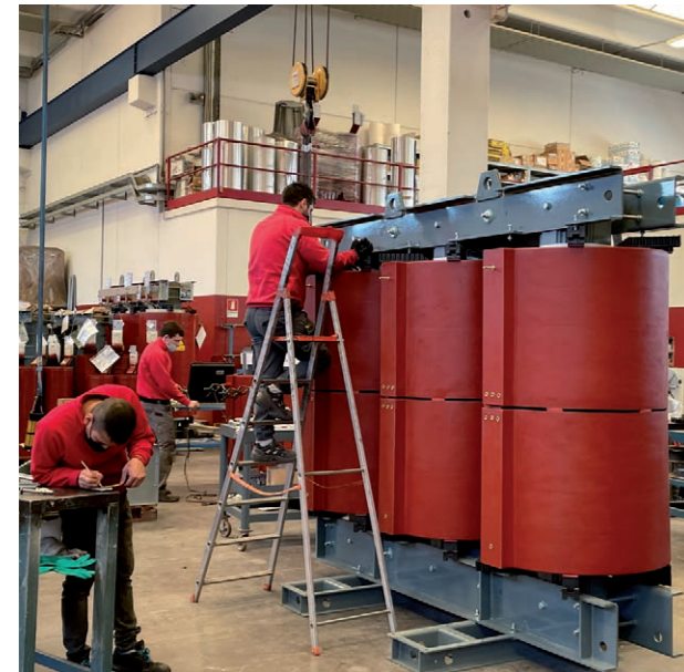
Transformador 5,5 MVA 10,5/15,75kV

A partir del 1 de julio de 2021 está en vigor el Tier 2 de la Norma Europea EN50588, que prevé una mayor reducción de pérdidas respecto al Tier 1, garantizando una mayor eficiencia energética y consecuente reducción de emisiones de CO 2 .