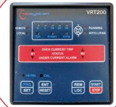
CENTRALITA PARA EL CONTROL DE LA VENTILACIÓN FORZADA VRT200