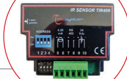
SENSOR INFRARROJO TIR409