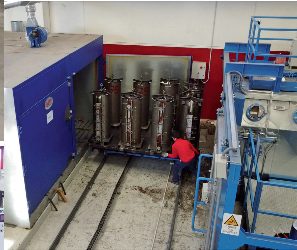
INSTALACIÓN DE ENCAPSULADO