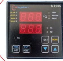
CENTRALITA NT935 (ANALÓGICO/DIGITAL O ETHERNET)