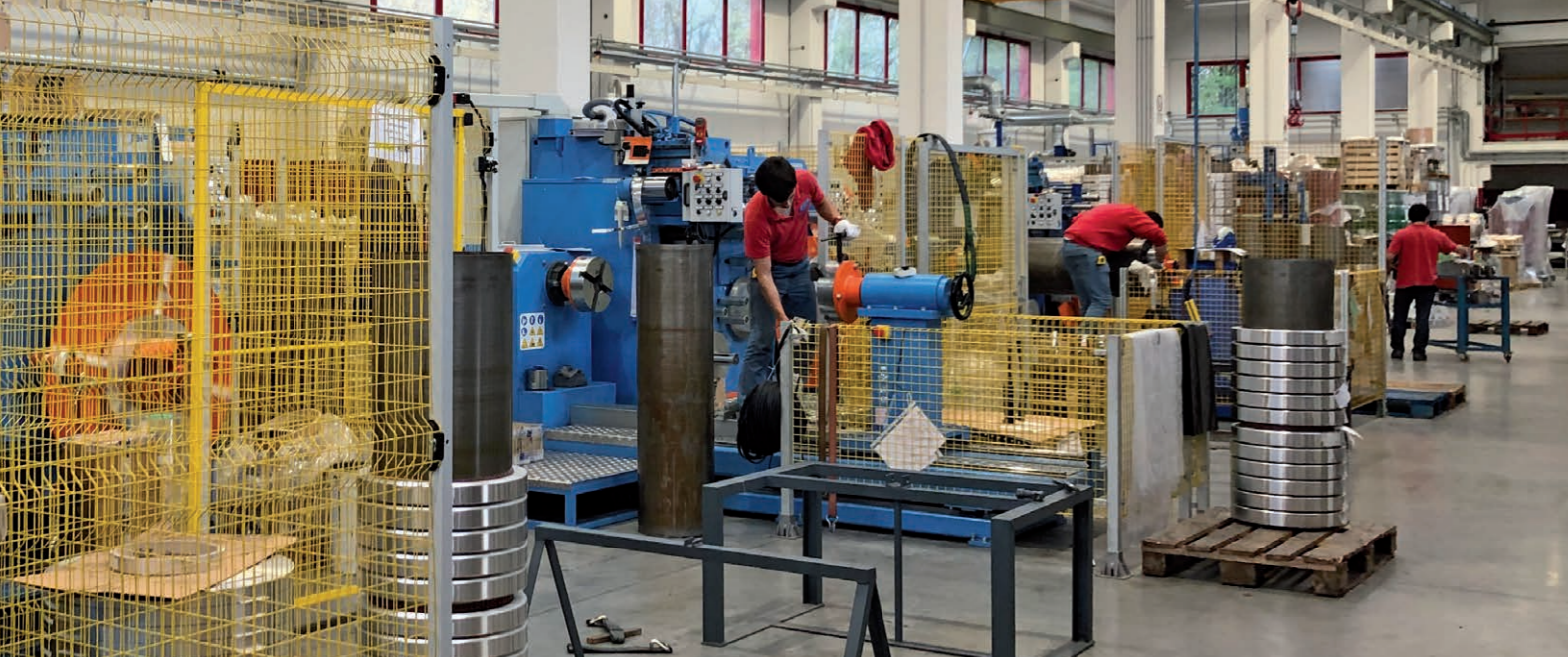
MÁQUINAS BOBINADORAS DE ÚLTIMA GENERACIÓN PARA LA REALIZACIÓN DE BOBINADOS AT/BT