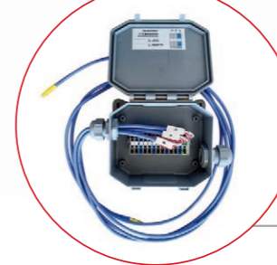
SONDAS PT100 Y SU CAJA DE BORNES