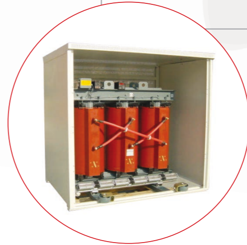
ENVOLVENTE EN IP31